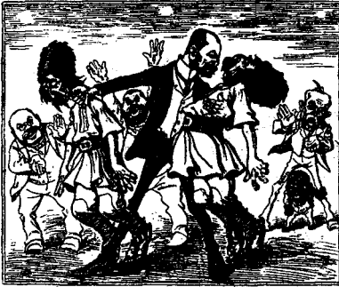
Tisza: talis regnum? et apud, utique et ceteris in part.

Gândiți-vă că o astfel de ilustrație a colindat din mână în mână pe la zeci de mii de cetitori, ba și analfabeți și copii cari abea știu să buchisească.