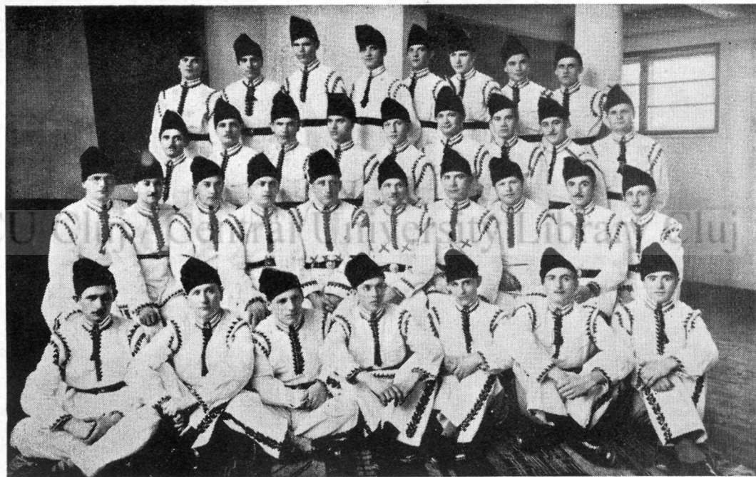
Corul „Șoimii Carpaților” din Câmpia-Turzii.