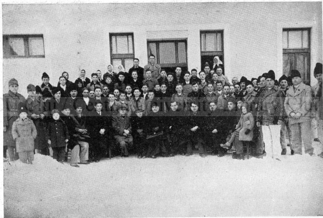
Școala țărănească din Iernut (jud. Târnava-Mică).