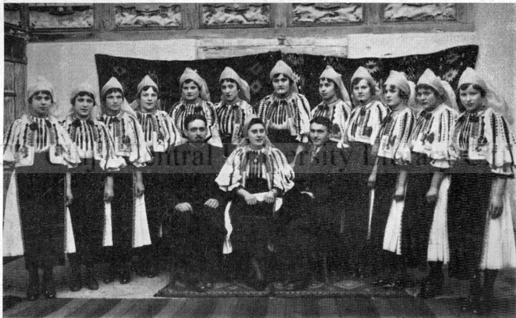
Școala țărănească din Tilișca (jud. Sibiu).